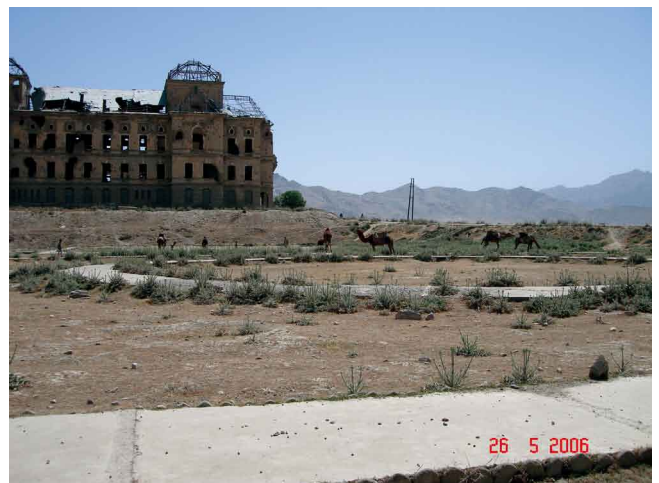
Afghanistan: Blick auf den ausgebrannten Palast König Amanullahs in Kabul.

XII. In mancher Hinsicht ist die Renaissance noch die Krönung und erst der Manierismus die Überwindung des Mittelalters. In seinem die mentale Verwandtschaft von 16. und 20. Jahrhundert unterstreichenden Buch „Die Welt als Labyrinth“ resümiert Gustav René Hocke: „Während unserer Forschungen fiel es uns immer wieder auf, welche Rolle das Auge, und zwar das einzelne Auge ... in der manieristischen Kunst damals und heute spielt.“ Klassiker der Moderne, für die das Auge, ob jetzt isoliert oder paarig, bevorzugter Ausdrucksträger war: Jawlensky, Picasso, Klee, Miró, de Kooning, Nay, Antes, Penck; bei den Surrealisten wie den Malern der CoBrA-Gruppe, teils auch bei den Vertretern der Neuen Figuration und der Jungen Wilden kann von einer regelrechten Augen-Besessenheit geredet werden. Niemand, der den von Luis Buñuel und Salvador Dali gemeinsam ausgeheckten Film „Ein andalusischer Hund“ gesehen hat, wird, lebenslang, die Schock-Szene vergessen, in der ein