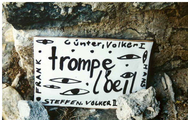
Mirabel 1998: Das Schild zur Ausstellung.

So fiel mein Blick irgendwann auf jene Steine, die ganz Mirabel bevölkerten. Steine aus Basalt, Kalkstein und Scherben der alten Dachziegel. Alle Straßen waren voll damit, jeder Schritt davon bestimmt. Ich fing an, diese Steine (und auch eine alte, rote Gieskanne) mit Augen und Tieren zu bemalen.