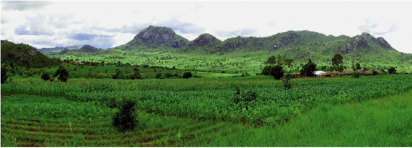
Malawi: Der Stein blickt nach Südwesten, die Berge gehören bereits zu Mozambik.

Mineralisches und Organisches durchdringen einander in dieser seltsam heidnischen Auffassung von „urengelhaften“ Wesenheiten bis zur Identität.