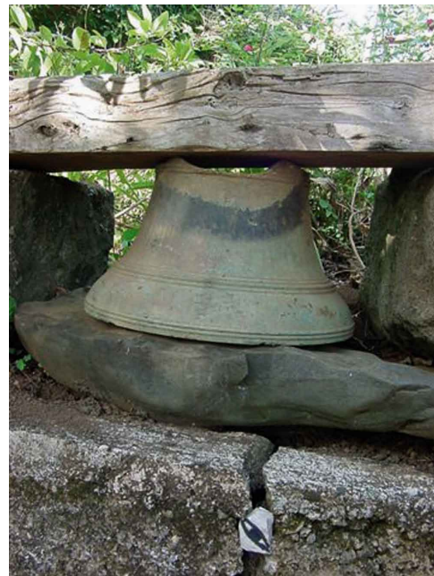
Pitcairn: Die Schiffsglocke der Bounty

Es sind dies Steine, zu denen ich keine Rückmeldung erhielt, Steine, die auf dem Postweg verloren gingen, Steine, die gekauft oder einfach mitgenommen wurden, Steine, die weiterverschenkt wurden. Und nicht zuletzt Steine, die in Bücherregalen, Schubladen, Kunst- und Mineraliensammlungen und Gärten vor sich hin schlummern.