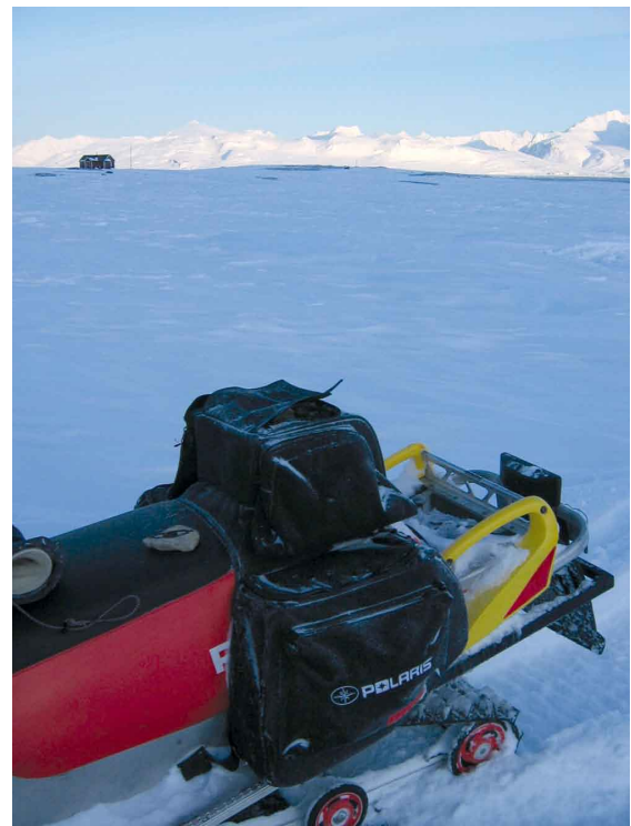
Spitzbergen: Stein auf dem Schneemobil

Im letzten Jahr gelang es, vollkommen entlegene Ziele zu erreichen, darunter die Küste des ausgetrockneten Aralsees, Samoa, die Phosphatinsel Nauru und Pitcairn, jene Insel, die von den Nachfahren der Bounty-Meuterer bewohnt wird.