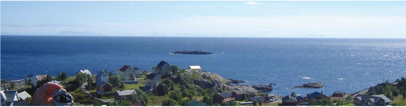
Norwegen: Å, das Auge schaut auf den Malstrom, wo Edgar Allens gleichnamige Erzählung spielt.

stand, daß seiner Aufmerksamkeit nichts entgehen konnte. (Was aber nicht verhinderte, daß Zeus die Geliebte ab und zu in Stiergestalt bestieg.) Als Zeus-Sohn Hermes von Ios unwürdiger Situation erfuhr, lullte er, listig wie immer, Argus in den Schlaf und schlug ihm das Haupt ab. Zum Lohn für geleistete Hirtendienste und zur Erinnerung an die heimtückische Ermordung löste Göttermutter Hera behutsam die Augen von der Leiche und pflanzte sie in die Schwanzfedern des Pfaus.