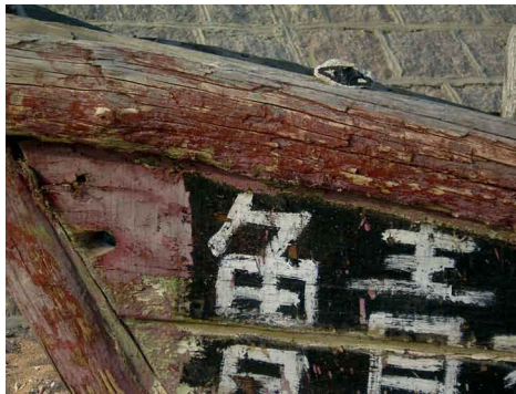
China: Fischerboot in Tsingtau.

Steine gehen auf eine Reise. Rund um die Welt. In jedes Land der Erde. Alle Steine tragen ein aufgemaltes Auge. Jeder Stein berichtet, was er sieht.