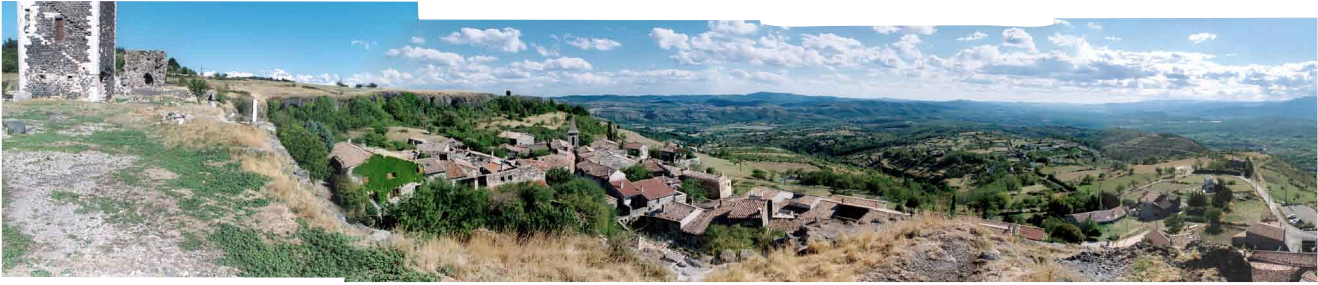
Mirabel/Ardeche: Der Blick nach Osten und Süden...