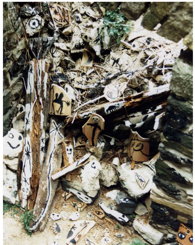
Trompe l'Œil, 1998

Meine Reise begann am 13.9., also zwei Tage nach den Anschlägen in New York und Washington.