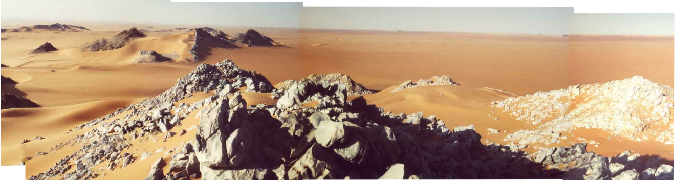
Niger: Die Marmorklippen der Montagnes Bleues

Rasiermesser das weitgeöffnete Auge einer jungen Frau horizontal zerschneidet – des Menschen königlichstes Organ, das gleichzeitig sein verwundbarstes ist.