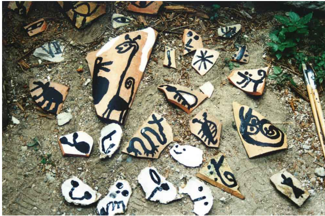
Bemalte Steine, Scherben und Austerschalen.