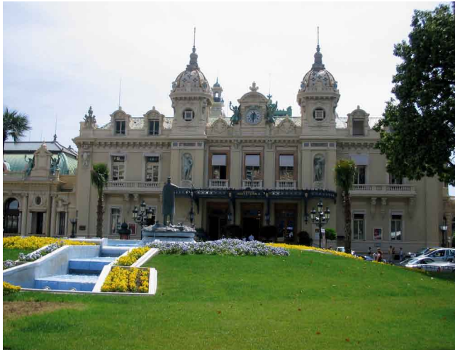
Monaco: Augenstein vor dem Spielkasino

Auge, mit einem maskierten Köpfchen als Pupille in der Mitte. Oder als querliegende Mandorla.