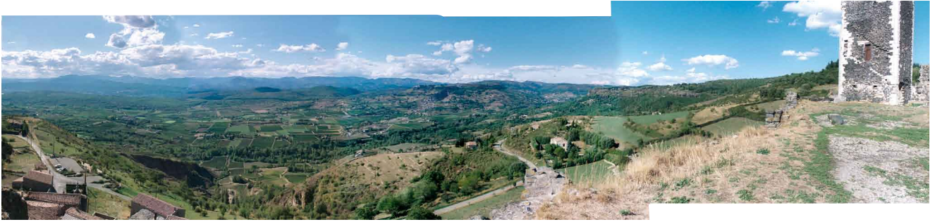
Mirabel/Ardeche: Der Blick nach Westen und Norden.

In Taschkent gelang es tatsächlich, einen Fahrer zu finden, der nach Samarkand fuhr. Bei einer kurzen Rast am Rande der Wüste Kysylkum legte ich ohne große Überlegung einen Augen-Stein an die Straßenböschung.