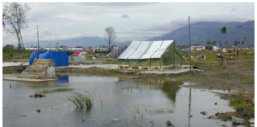
Indonesien: Banda Aceh, nach dem Beben. Der Stein liegt im Wasser.

XVIII. Anders freilich ist das Verhältnis von Zeitwesen und Dauerwesen, beweglichem und starrem Partner in Volker Steinbachers Weg der Steine-Projekt. Schon das Wort „Augenstein“ verrät, daß sie ineingebracht sind, das halb-abstrakte Zeichen und der höchst konkrete Gegenstand. Es bedarf keines Opals, um das mineralische Reich