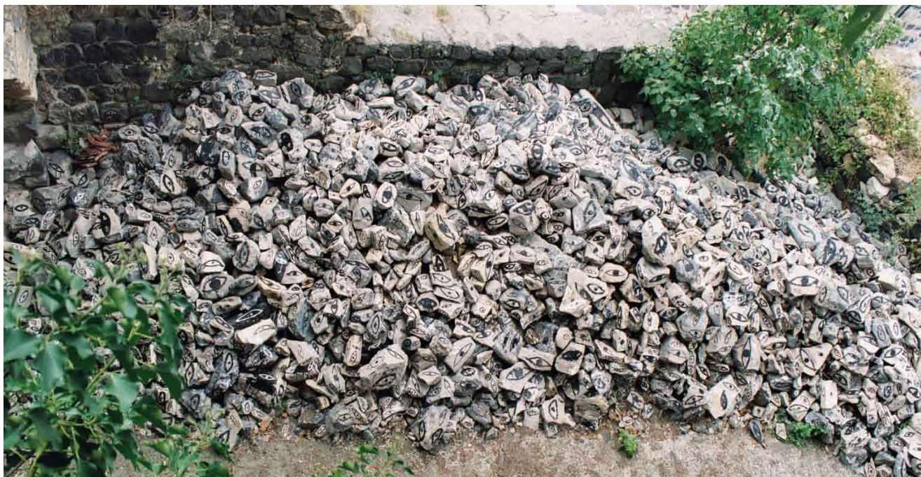
Im Jahre 2003 wurde eine große Zahl abgeräumter Wegsteine bemalt.

Und ein Konzept, in dem die Spielregeln festgelegt wurden.