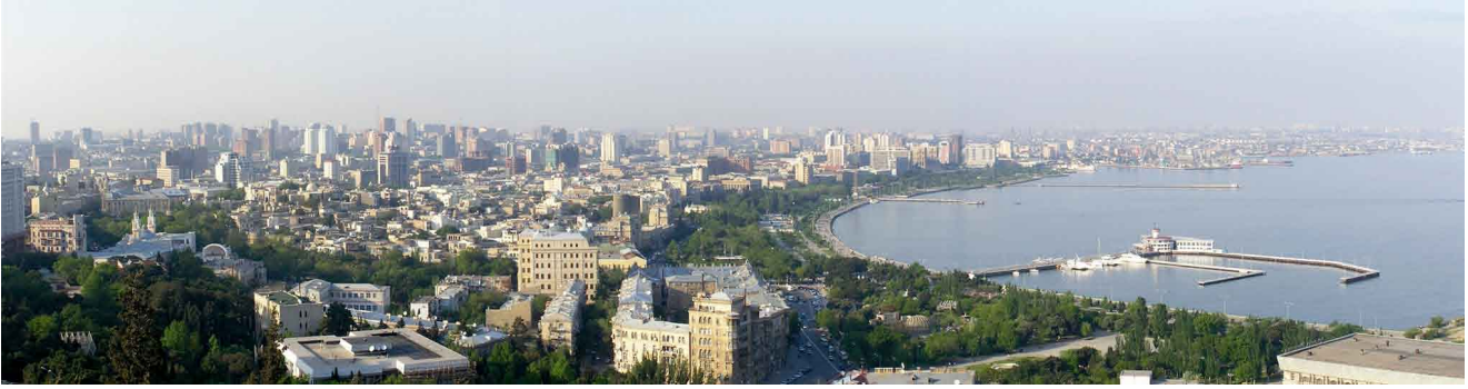
Aserbaidshjan: Der Stein liegt an der Strandpromenade von Baku in einer kleinen Palme.

endlich ein Auge aufschlagen zu lassen! Lange bevor der Weg der Steine am Ziel angekommen ist, hat der Globus etwas vom mit „heterotopischen“ Augen gewappneten Leib der Cherubim und Seraphim angenommen, glänzt er vor „Alläugigkeit“ wie Argus, ist er vom blinden zum Augenwesen geworden.