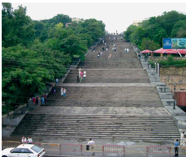
Ukraine: Die Potemkin'sche Treppe in Odessa.