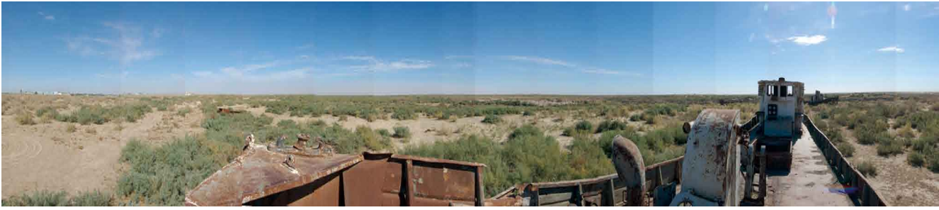
Usbekistan: Der Blick des Steines vom Fischerboot „Karakalpakija“ auf den ausgetrockneten Aralsee.