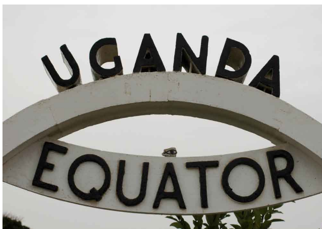
Uganda: Am Äquator in Entebbe.

I. Von Jacques Callot, dem lothringischen Radierer des frühen 17. Jahrhunderts, bekannt durch seine realistischen Graphikzyklen zu den zeitgenössischen „Schrecken des Krieges“, gibt es ein Blatt, betitelt „Das wachsame Auge“. Man sieht darauf, inmitten arkadischer Wald- und Hügellandschaft, eine umzäunte, von einem Hund bewachte Herde, deren Mitglieder zu klein dargestellt sind, als daß sie sich mit letzter Sicherheit als Rinder oder Schafe bestimmen ließen. In unserem Zusammenhang wichtiger: im Vordergrund erhebt sich senkrecht ein schlanker Stecken, von dessen Spitze, sehr surreal, ein Auge samt näherem Kopfumfeld absteht, geöffnet, den Betrachter frontal fixierend. War es Callot zu tun um eine Allegorie der Wachsamkeit generell? Oder bezieht sich das emblematische Motiv auf