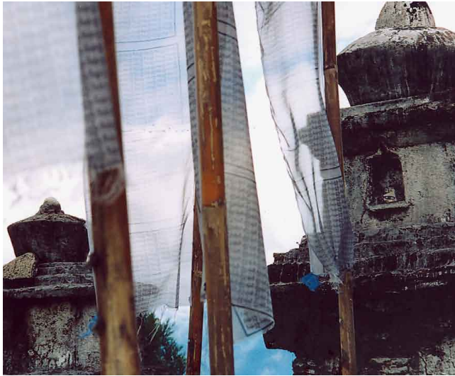
Indien: Der Stein in der Nische einer Stupa des Sangh-Gak Choling Klosters.

Basalt-, Kalkstein- und Ziegelbrocken, typisch für einen bestimmten Flecken in der südfranzösischen Provinz, gehen auf Reise in alle Richtungen der Windrose, um ihren Dauerplatz zu finden an idealerweise 197 Örtlichkeiten, deren es jedoch realiter bereits wesentlich mehr gibt – Tendenz unendlich?